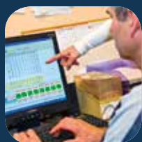
Bases de datos y sistema de información