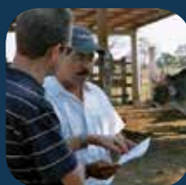
Zootecnistas y agrónomos