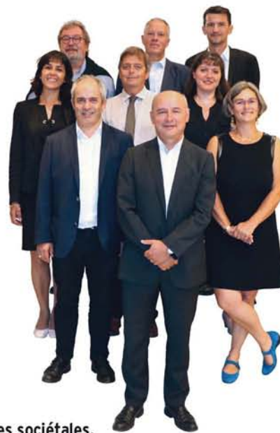
L' équipe de direction. À l'écoute des éleveurs et de leurs partenaires, elle impulse les projets et manage les équipes.

Les travaux de recherche et développement de l'Institut de l'Élevage s'articulent autour de thématiques qui répondent aux enjeux principaux pour l'élevage d'herbivores et ses filières : créer de la valeur via des filières structurées et des démarches de qualité ; prendre en compte les attentes sociétales, notamment autour de l'environnement et du bien-être animal ; optimiser le fonctionnement technique, économique et organisationnel des exploitations d'élevages ; contribuer à améliorer et gérer les populations animales de demain ; s'intégrer pleinement dans un monde numérique et connecté.